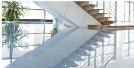
Pisos de Piedra