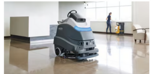
Pisos de Concreto